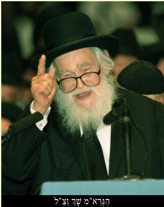
הגרא"מ ש"ך זצ"ל

בעברה, על אחת כמה וכמה שמי שמקדים לתפלה ולשאר המצוות זוכה לשכר בלי גבול ומדה. אין לשער את גדל ההבדל בין מי שבא לתפלה בזמן לבין מי שבא לתפלה לפני הזמן. הגרא"מ ש"ך היה אומר כי אם אנשים היו יודעים את גדל מעלתו של המגיע מעשרה ראשונים לבית המדרש, הם היו עומדים בתור בכניסה וכל אחד היה רוצה להיות הראשון שיכנס פנימה. הגרא"מ ש"ך דורש בדרך צחות את באור רש"י על הפסוק: "ומשה עלה אל האלקים - וכל עליותיו בהשכמה היו, שנאמר וישכם משה בבקר" (שמות יט, ג), ללמדנו שכל ההתעלות, ההצלחה, והסיעתא דשמיא ברוחניות ובגשמיות מגיעות על ידי ההשכמה. ואכן הגרא"מ ש"ך היה נאה דורש ונאה מקים. בכל בקר הוא היה מגיע לבית המדרש רבע שעה לפני התפלה, כשהוא עטור בתפלין לאחר שאמר את כל ברכות השחר בביתו. רבע שעה לפני התפלה, הוא כבר היה מתישב במקומו ומתחיל לומר את פסוקי דזמרה במתינות כמונה מעות. (רבי יעקב שיש שליט"א - לרומם)