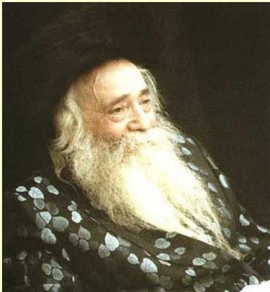
האדמו"ר בעל ה"שפע חיים" מקלוז'נבורג וצ"ל

בְּאֶחָת הַשְּׁבִתוֹת שֶׁקִּרְאוּ בְּפִרְשַׁת הַתּוֹכְחָה, הָיָה בְּבֵית הַבְּנִיָּסָה שְׁנֵי חֲתָנִים, יְתוּמִים מְאֹבָא וְאִמָּא, שְׂאֵת שְׁנֵיהֶם לָקַח תַּחַת חֲסוֹתוֹ, גִּדֵּל אוֹתָם וְכַעַת הַשִּׁיאָם. שְׁנֵיהֶם צְרִיכִים לְקַבֵּל עֲלֵיהָ לַתּוֹרָה בְּשֶׁבֶת הַזֹּאת. לִפְנֵי הַתַּפְּלָה הוּא נֹגֵשׁ לְאַחַד מֵהֶם וְאָמַר לוֹ: "אֲנִי רוֹצֵה לְתַת לָךְ הַיּוֹם אֶת הָעֲלִיָּה שֶׁל הַתּוֹכְחָה".