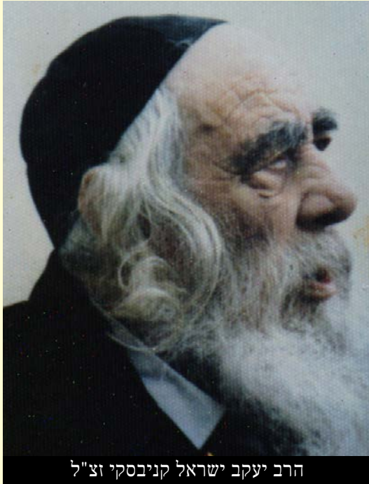
הרב יעקב ישראל קניבסקי זצ"ל