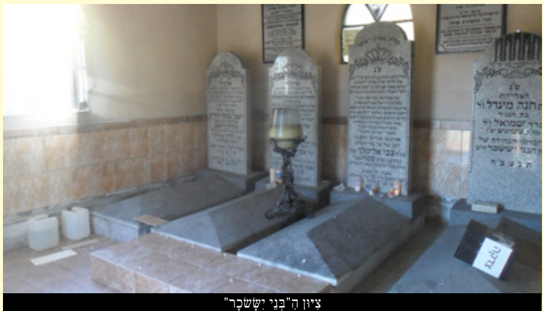
צִיּוֹן ה"בְּנֵי יִשְׂשֹׁכָר"

'יוֹסֵי, אֲנִי רוֹצֶה לְסַפֵּר לְךָ מִשְׁהוֹ שִׁירְגַשׁ אוֹתָהּ מְאֹד. אַתָּה לֹא תֵאֱמַר אֲבָל אִמָּא שְׁלָה סִפְרָה לְאִשְׁתִּי, שְׂבִמְשֶׁה עֲשֹׂר הַשָּׁנִים הָאֲחֵרוֹנוֹת הִיא לֹא נוֹעֵלֶת אֶת דֵּלֶת הַבֵּית בְּלִילָה. בְּכָל עָרֵב הִיא מְצַפֶּה וּמְקוֹה, שְׂאוּלֵי הַלִּילָה יוֹסֵי שְׁלָה יְחַלֵּט לְחַזֵּר הַבֵּיתָה. בְּמִשְׁהָ עֲשֹׂר שָׁנִים אִמָּא