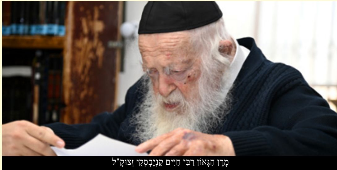
מֶרֶן הַגָּאֹן רַבֵּי חַיִּים קִנְיָבְסְקִי זצ"ל

(רַבֵּי גּוּאֵל אֶלְקָרִיף שְׁלִיט"א – שֶׁשׁ בְּאִמְרַתְךָ שְׁמוֹת)