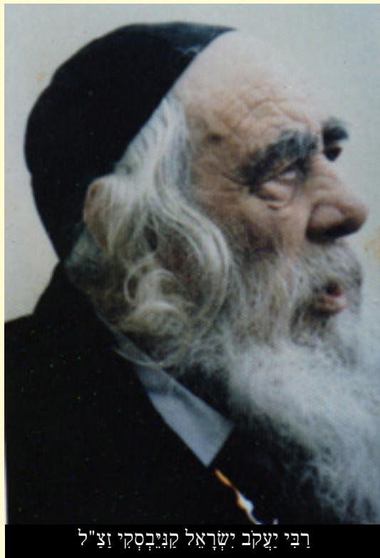
רבי יעקב ישראל קניבסקי זצ"ל