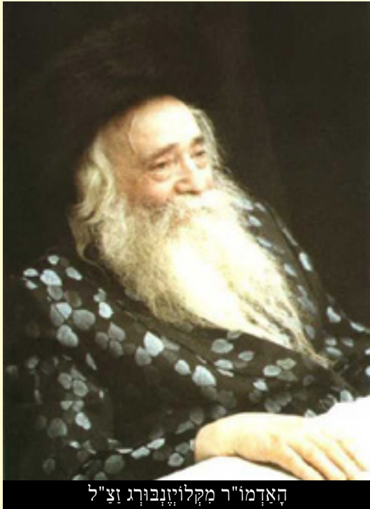
האדמו"ר מקלויזנבורג זצ"ל

כחה, תרצת לי בכה קשיה גדולה שהיתה לי אודות הסבה שאותה מונה הקב"ה להוצאתם של ישראל ברכוש גדול ממצרים.