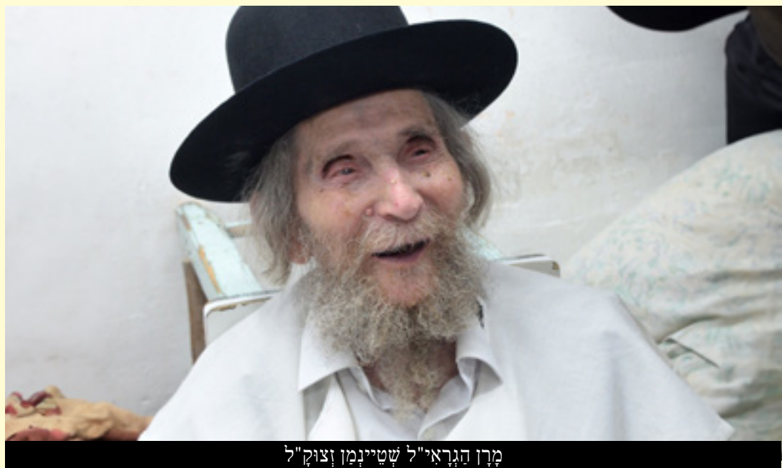
מֶרְוֹן הַגְּרָאִי "לְשֵׁטִינְמוֹן זְצוּק"

מֵאִין לוֹ לְיוֹסֵף הָעוֹ וְתַעֲצוּמוֹת הַנֶּפֶשׁ לְהִזְכִּיר לְפָרְעָה שׂוֹב וְשׂוֹב אֶת שְׁמוֹ שֶׁל הַקֶּב"ה, בְּשָׁעָה שֶׁפְּרָעָה כּוֹפֵר