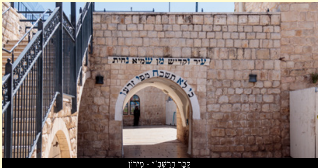
קבר הרשב"י - מירון

"את כל זה אני יודע. נגשתי אליה כדי שתעזר לי, אוילי בכל זאת תמצא איזושהי דרך שלא יגבו ממני..." "איזו דרך אתה מבקש שאמצא? מילא אם היו לוקחים