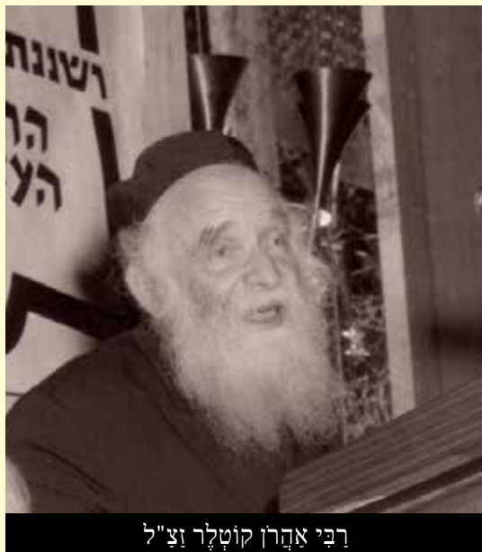
רַבֵּי אֶהְרֹן קוֹטְלֵר זצ"ל

שׁוֹב, הַגְּבִיר לֹא הִבִּין אֶת כּוֹנֵת רַבֵּי אֶהְרֹן. פְּנִי