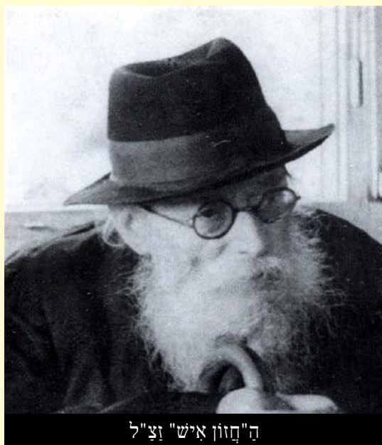
ה"חזון איש" זצ"ל

משמים, משום שיש בו תשובה גדולה לשאלתך: איש עסקים גדול מחו"ל שלח את אשתו לעשות עסקה גדולה פאן, בארץ ישראל. מדבר היה בקניית שטח גדול לבנינים, והיה עליה להגיע לבנין בתל אביב, בו ישבו כל אנשי העסקים ואנשי המקצוע הנדרשים לשם בצוע העסקה וחתימת החוזה. העסקה הייתה בכסף מזמן, ובעלה שלח עמה את הכסף. בעלותה במדרגות הבנין היא מעדה ונפלה. לקחו אותה באמבולנס לבית חולים לבדיקות. לאחר שהתברר שהכל ברוח ה' תקין, היא שבה לבנין כדי לחתם על החוזה. אולם, משפתחה את תיקה גלתה לתדהמתה שהכסף איננו! ככל הנראה נפל מהתיק