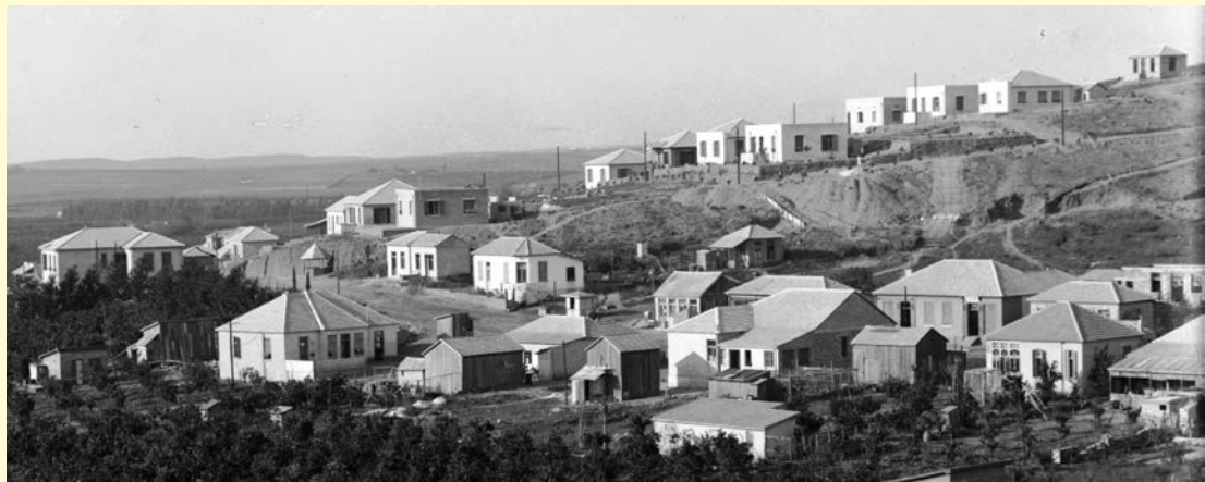
בני ברק בשנותיה הראשונות

אפלו בעשירית מרכושי, הייתי כיום מיליונר. עכשיו אין מגרשים, ומכל הזקב לא נשאר בְּיָדֵי מאום... ספור זה גרם לי התעוררות עצומה: