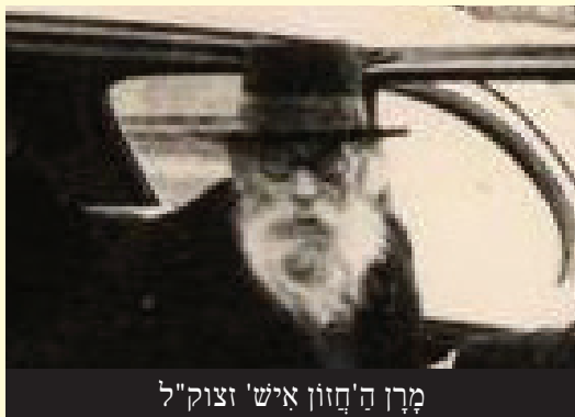
מרן ה"חזון איש" וצוק"ל