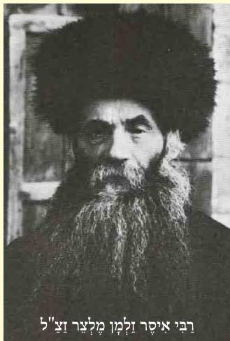
רבי איסר זלמן מלצר זצ"ל