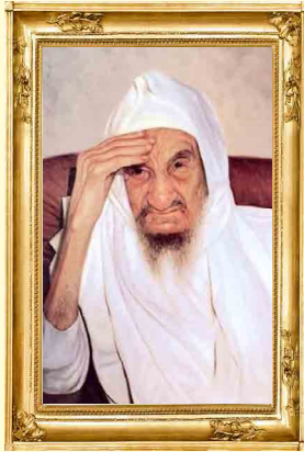
רבי ישראל אבוחצירא זצ"ל

השמן על הרצפה. והלהכה שפגעה בשטיח, גרמה לו להתחיל לבער הביט ה'בבא סאלי' על האש ואמר כמשוחח עמה: "כאן בבית שומרים שבת; איך לה רשות לבער כאן!", והאש נעצרה במקום!!! ה'בבא סאלי' היה קדוש עליון, תלמיד חכם וצדיק מפלג, והספור הזה הוא לא מופת של פתאים - זהו כח בסיסי של כח הדבור. כח שהיה יכול להיות לכל יהודי, אלו רק היינו שומרים כראוי על הפה שלנו!