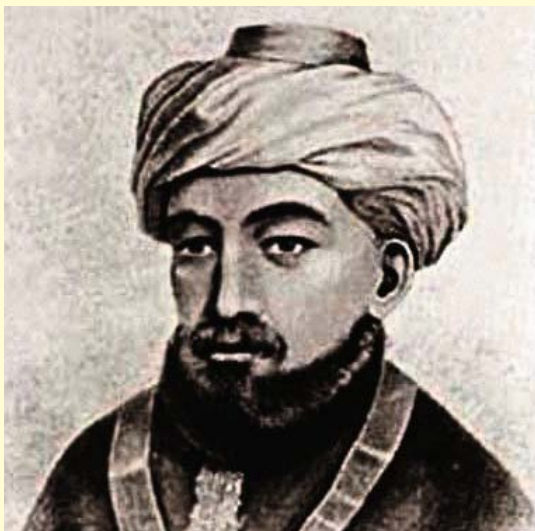
רבי משה בן מימון | הרמב"ם

בשובו לארמון קרא המלה לרבי משה ואמר לו: לה אל מפעל הלבנים ושאל את בעל המפעל: "האם