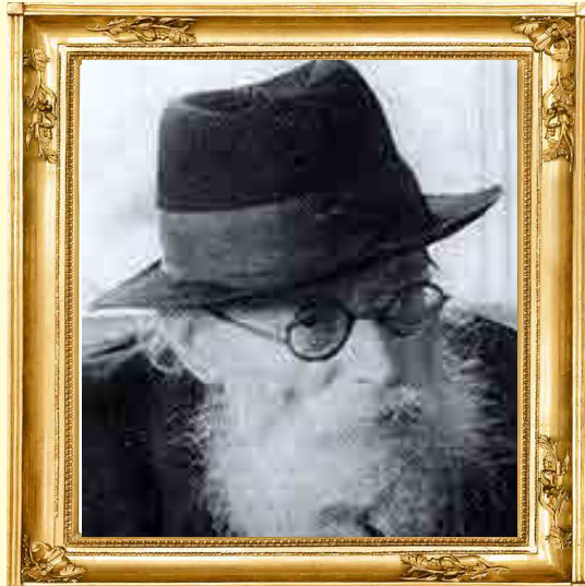
מרן החזון אי"ש זצוק"ל

השם ממרתפי הזכרון: זה היילד מילדי טהרון. האמלל שהגיע לארץ ולא ידע צורת אות! ועתה, עיניו הרואות: אותו ילד אמלל וחסר כל סכוי, פרח לתפארה, גדל לבחור מפלג בתורה וביראת שמים! אותו ילד שלא ידע ללמד מלה, התחייב ללמד 500 דפי גמרא בחצי שנה! לא יאמן כי יספר!