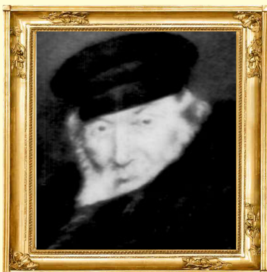
רבי ישראל מאיר הכהן, החפץ חיים זצוק"ל