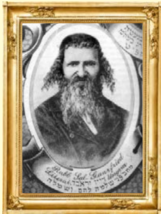
רבי שלמה בן יוסף גנצפריד זצ"ל, מחבר "קצור שלחן ערוה"