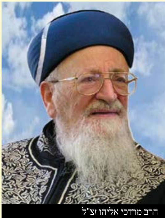
הרב מרדכי אליהו זצ"ל