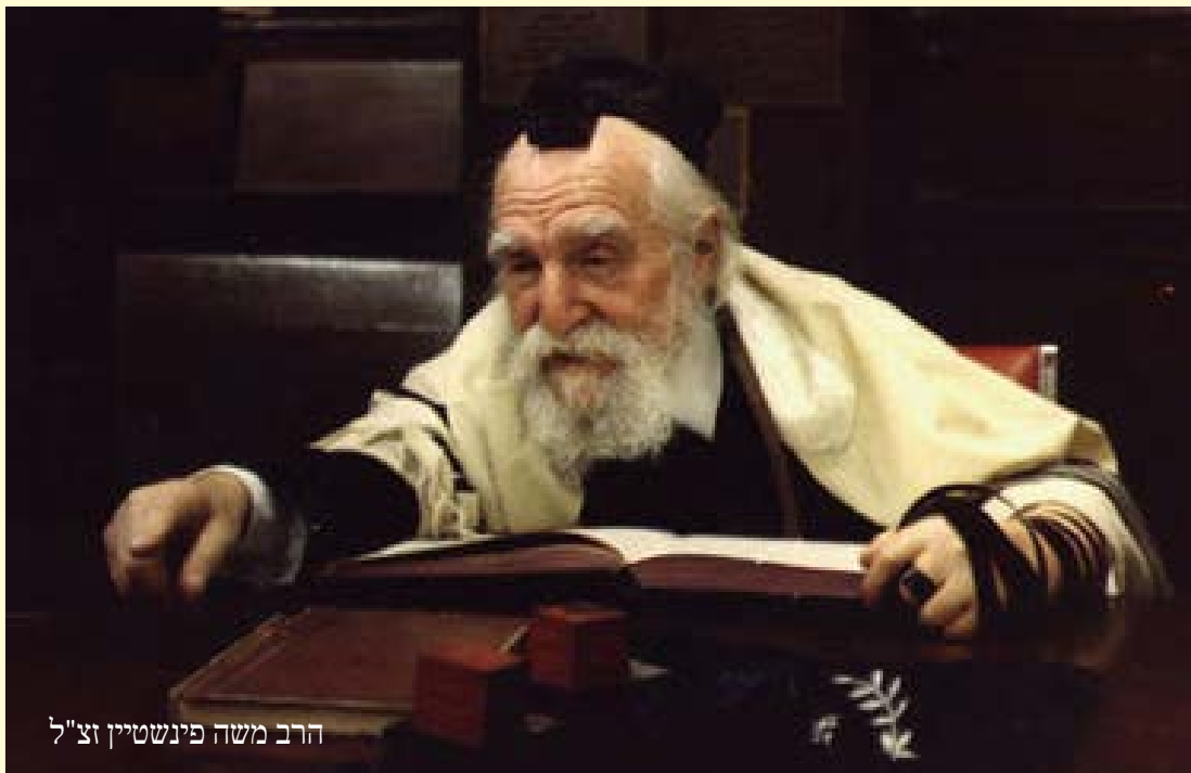
הרב משה פיינשטיין זצ"ל

בפרשתנו נקרא על חטא העגל. החטא החמור בו מרבית העם נהה אחרי הערב רב' שקם ודרש לעשות תחליף למשה רבינו שחשבו כי הוא מת. מרוב שהחטא חמור, הוא בלתי מוכן לחלוטין! קטנים אנו מלהבין את אירועי הימים ההם. הבה ניקח ונלמד נקודה מעשית אחת: כח לימוד התורה! היחידים שנשמרו ועמדו ביראת ה' ולא השתתפו בחטא זה, הם שבט לוי. כאשר משה רבינו הכריז "מי לה' אלי", מספרת התורה: "ויאספו אליו כל בני לוי". מה היה הדבר שכל כך השפיע עליהם ונתן בהם כח ועוז מול הסחף הנוראי? התשובה היא: כח